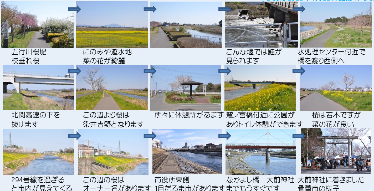
五行川桜堤 枝垂れ桜